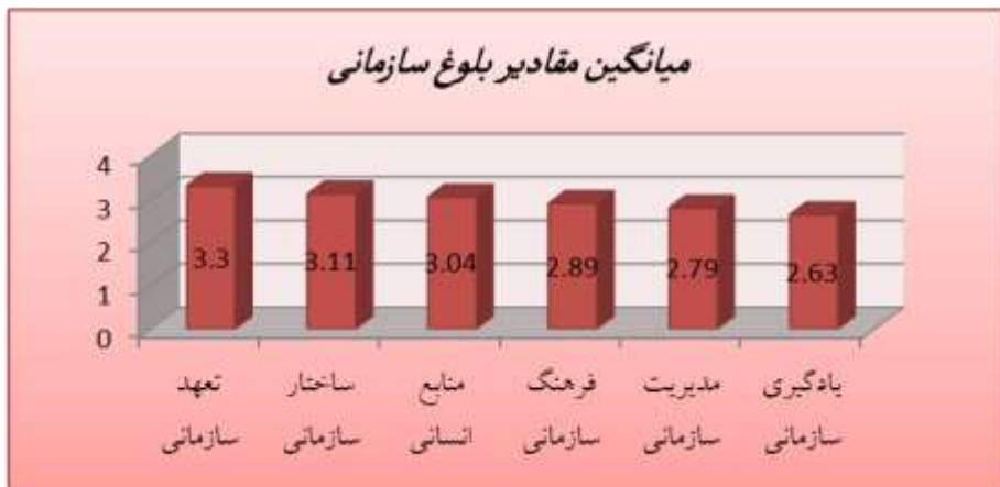
نمودار ۱. امتیازات ابعاد بلوغ سازمانی در دانشگاه آزاد اسلامی واحد رشت

پس از بررسی شش عامل یادگیری، فرهنگ، تعهد، ساختار، مدیریت و منابع انسانی سازمانی، نتایج حاکی از آن است که پاسخگویان معتقدند که میانگین میزان بلوغ سازمانی در دانشگاه آزاد اسلامی واحد رشت ۲/۹۶ می‌باشد که نشان از سطح نزدیک به متوسط آن دارد. از میان شش بعد بلوغ، تعهد سازمانی بیشترین امتیاز را کسب نموده و در رتبه اول قرار می‌گیرد، ساختار، منابع انسانی، فرهنگ و مدیریت سازمانی به ترتیب در رتبه‌های بعدی قرار گرفته و یادگیری سازمانی با کمترین امتیاز رتبه ششم را به خود اختصاص داده است. همچنین بر طبق نتایج، سه بعد تعهد، ساختار و منابع انسانی سازمانی دارای مقادیر بالاتر از حد متوسط بوده و شرایط نسبتاً مطلوبی دارند ولی سه بعد دیگر یعنی یادگیری، فرهنگ و مدیریت سازمانی دارای مقادیر کمتر از حد متوسط بوده و دارای شرایط نامطلوبی هستند و از نقاط ضعف دانشگاه در زمینه بلوغ سازمانی محسوب می‌شوند. میانگین نظرات کل پاسخ‌دهندگان به شش بعد بلوغ سازمانی به ترتیب از بیشترین تا کمترین امتیاز در نمودار زیر نشان داده شده است.