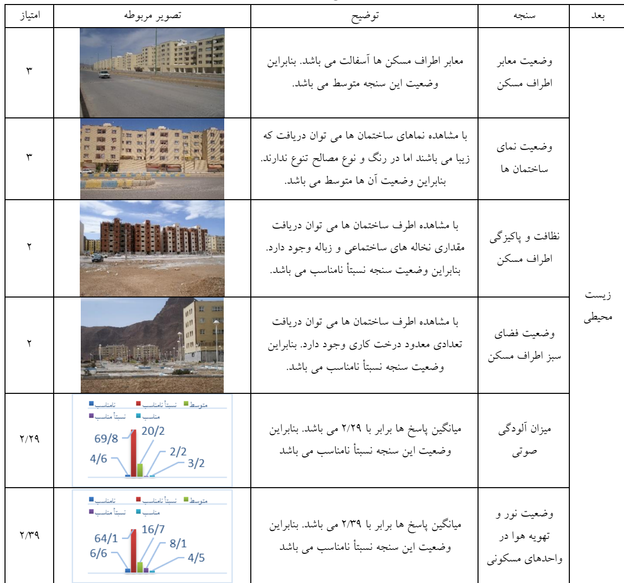
جدول ۶- امتیازدهی سنجه های ارزیابی طرح مسکن مهر شهر شهرضا به لحاظ بعد زیست محیطی