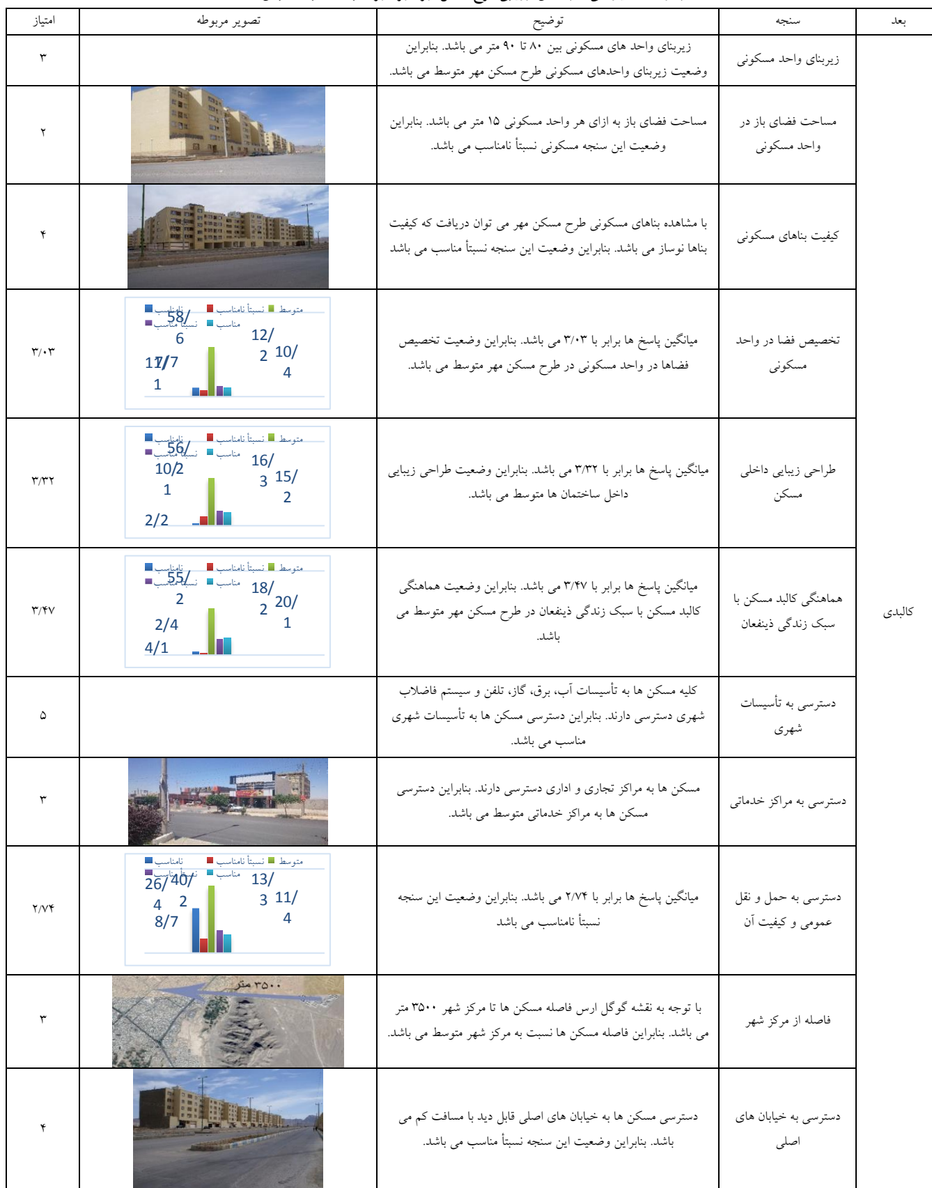
جدول ۷- امتیازدهی سنجه های ارزیابی طرح مسکن مهر شهر شهرباز به لحاظ بعد کالبدی